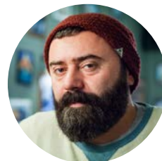
ДМИТРИЙ ЛЕВИЦКИЙ Москва

Эксперт туристской отрасли. Председатель Комитета Торгово-Промышленной Палаты России по предпринимательству в сфере туристской, курортно-рекреационной и гостиничной деятельности. Вице-президент Российского Союза Туриндустрии.