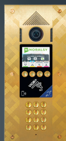
Caméra Grand-angle Finition laiton brossé