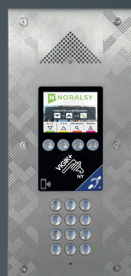
Caméra Pinhole Finition inox brossé