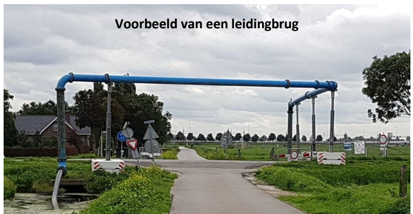
Voorbeeld van een leidingbrug