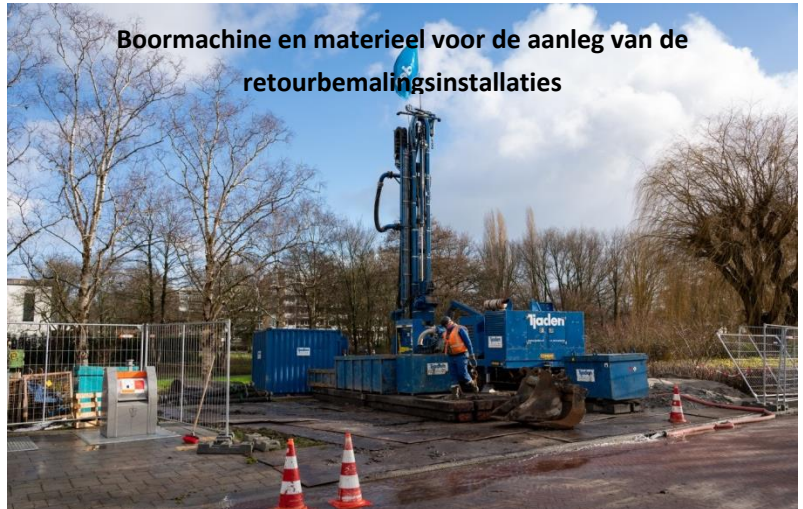
Boormachine en materieel voor de aanleg van de retourbemaalingsinstallaties