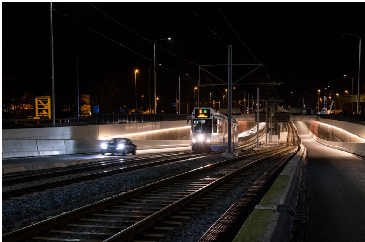
3 februari 2020: De eerste auto's door de bak van Kronenburg.

info@amstelveenlijn.nl 020-470 4070 (24/7) Twitter: @Amstelveenlijn Facebook.com/amstelveenlijn www.amstelveenlijn.nl