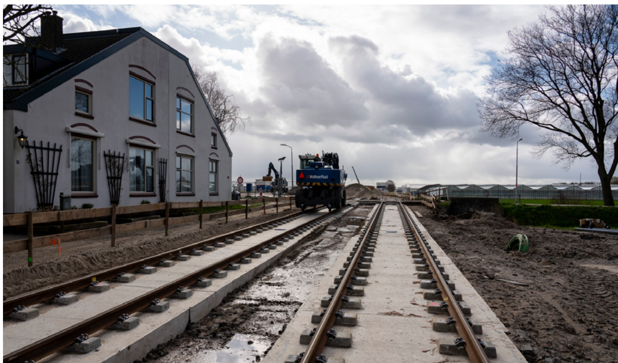
Nieuw spoor richting het opstelterrein