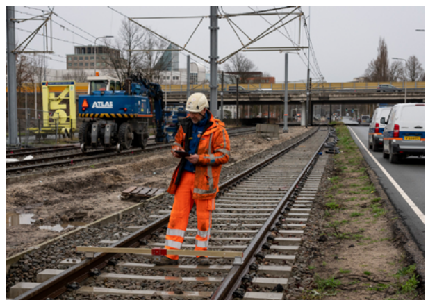
Werkzaamheden bij de Ouderkerkerlaan