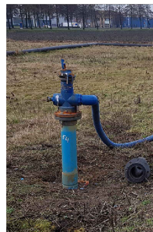
Voorbeeld retourbron (ca. 1,5m boven maaiveld)