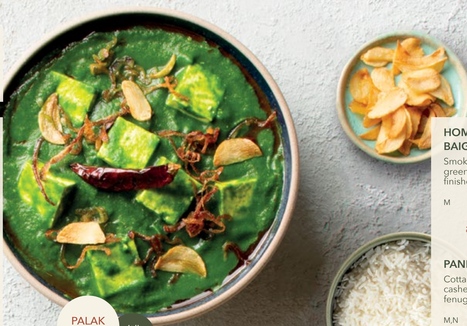
PALAK PANEER بالاك بانير

M | ٣٩ درهم | جوبهي موتر | القرنبيط والبازلاء الخضراء مقلاة في ماسالا الطماطم والبصل.