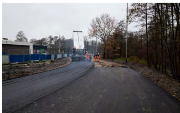
Asfalteringswerkzaamheden op de tijdelijke Beneluxbaan