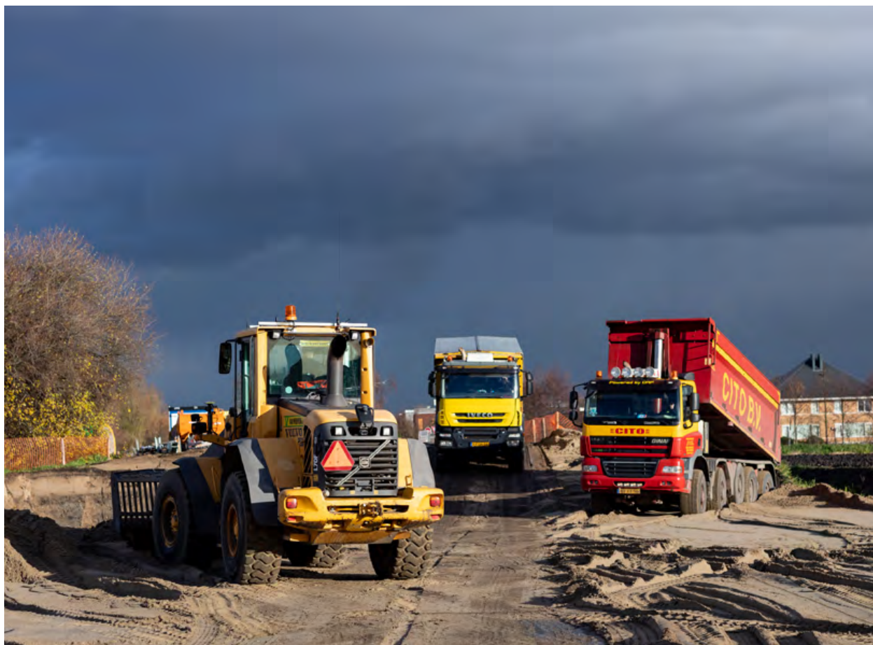
Er wordt nog druk gewerkt op het opstelterrain.