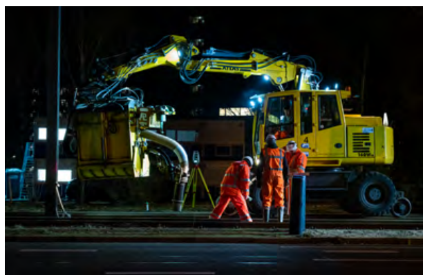
Nachlijke bomenkap en werkzaamheden in Buitenveldert