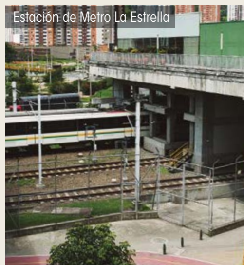
Estación de Metro La Estrella