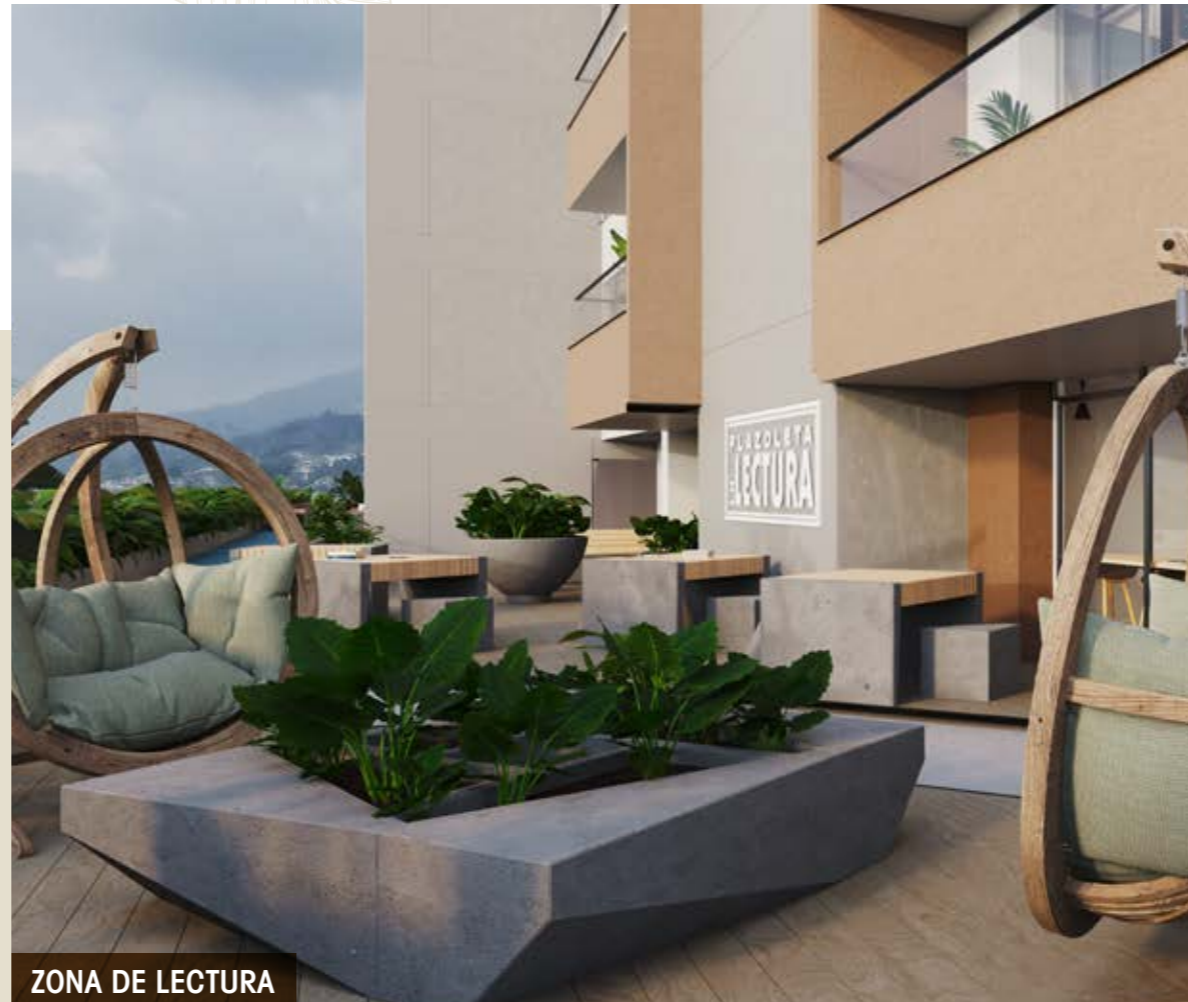
ZONA DE LECTURA