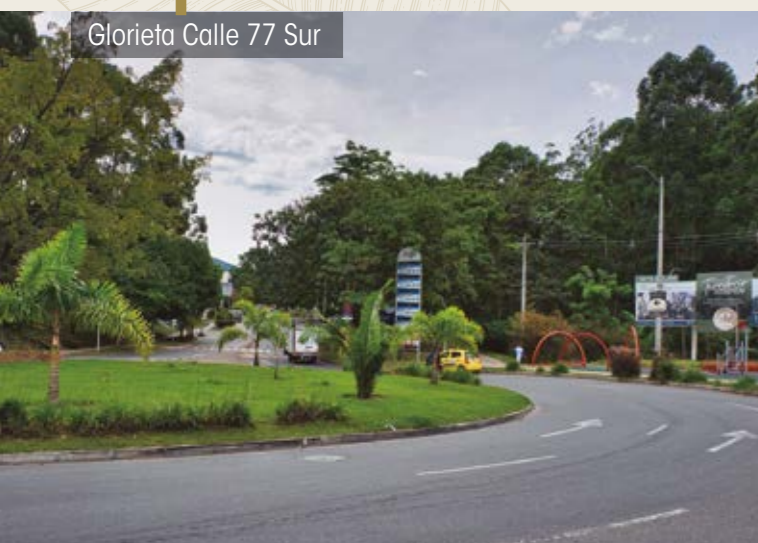
Glorieta Calle 77 Sur

VerdeVivo es un moderno e integral desarrollo urbanístico y arquitectónico en el sector Suramérica, que se convirtió en referente de ciudad por sus principios aplicados de sostenibilidad e innovación que permitieron la conservación del territorio y el ecosistema, haciendo de este un desarrollo habitacional exclusivo y vanguardista, pero sobre todo en armonía con la naturaleza.