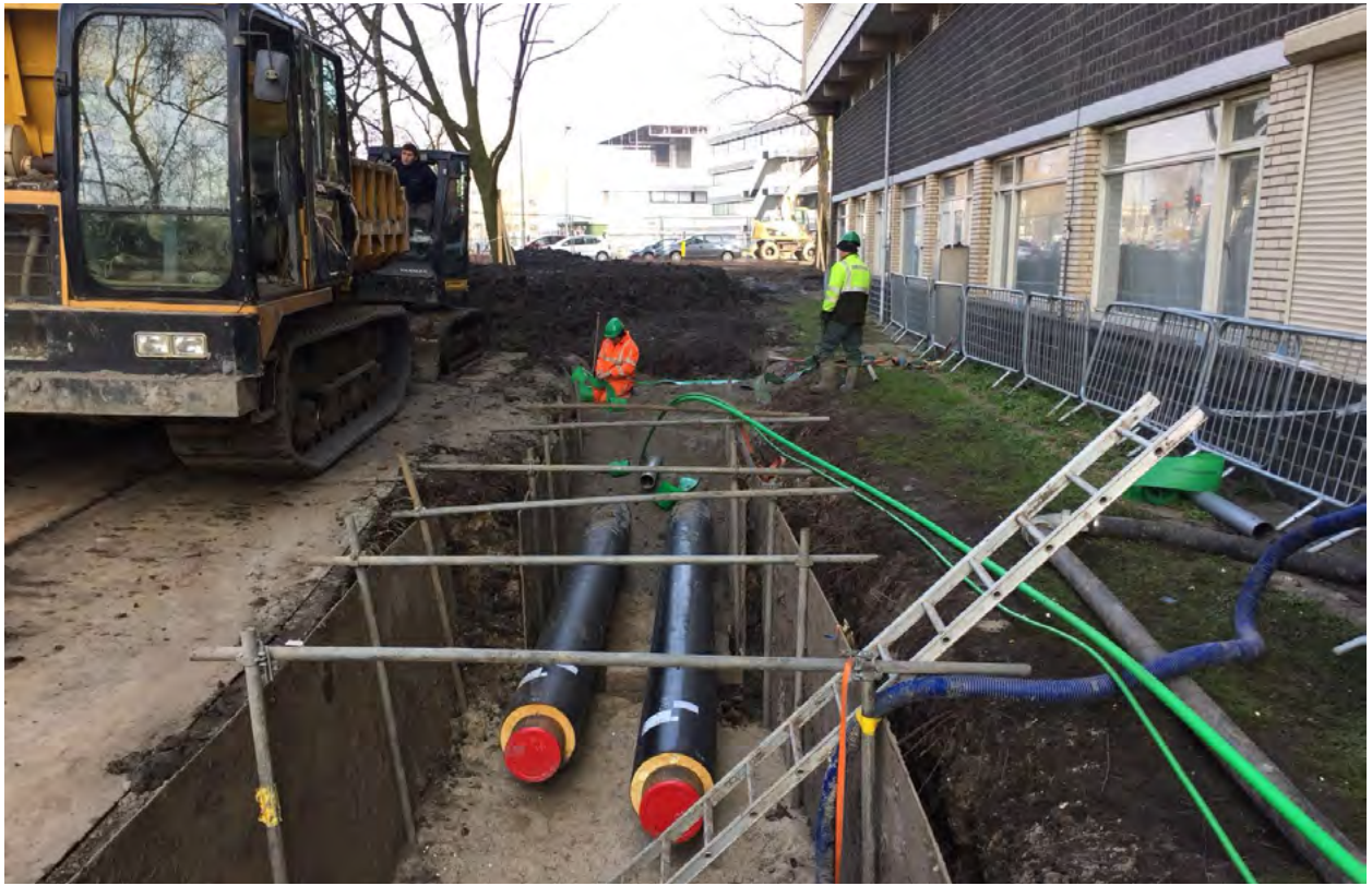
Nuon Warmte bij het Westelijk Halfgrond

Ook voor de nieuwsbrief hebben we een nieuwe rubriek: Het project in beeld. Hier laten we iedere keer een impressie zien van de werkzaamheden.