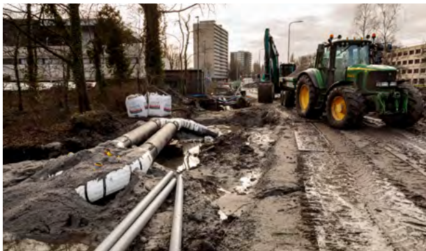
Veel regen, veel modder