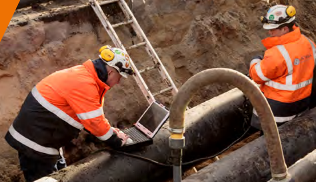
Werkzaamheden van Nuon Warmte

De Amstelveenlijn wordt vernieuwd. Met deze nieuwsbrief informeren wij u graag over actuele ontwikkelingen en nieuwe artikelen en interviews op onze website.