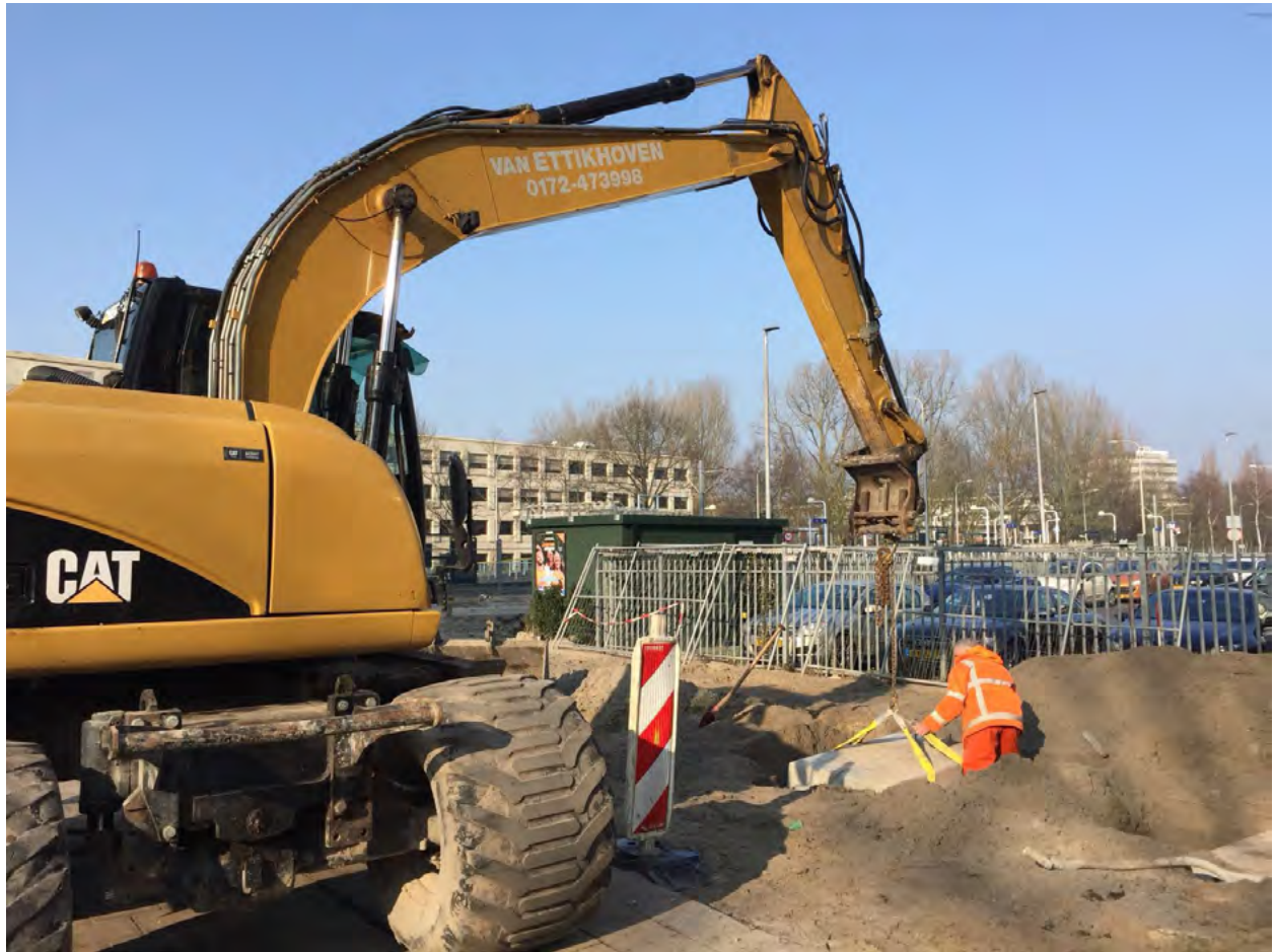
Terugplaatsen van het fundament van de fietsenstalling