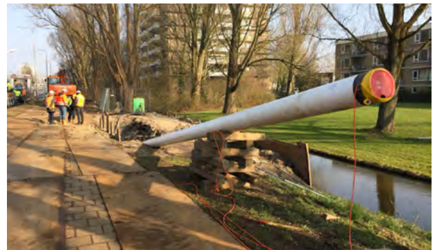
De Gasunieleiding zit grotendeels al in de grond