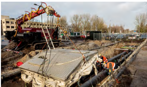
Nuon Warmte bij de Straat van Messina