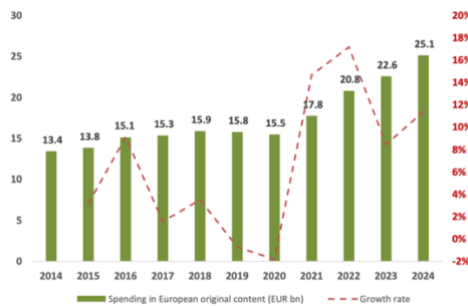
Spending* on European original content (EUR bn)