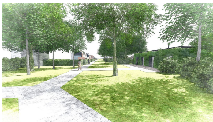
Groene inpassing onderstation Boerlagelaan

in het referentieontwerp. Daarmee ronden we het referentieontwerp voor de Uithoornlijn af. De aannemer maakt op basis van de eisen in de volgende fase een definitief ontwerp.