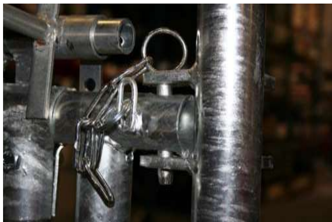
Låsning av front med bult – vänster sida