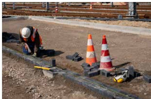
Hier komen straks de parkeerplaatsen voor onder andere de trambestuurders.