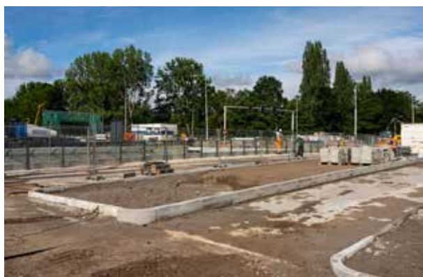
De ovaalrotonde bij Sportlaan krijgt al vorm.