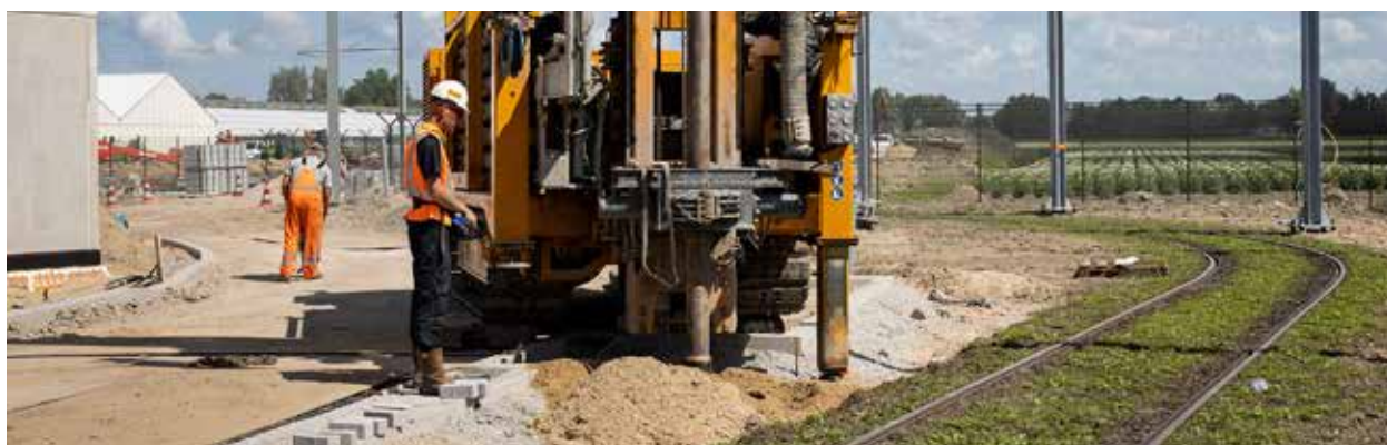
Het boren van een 43 meter diep gat op het opstel terrein. Hier kan de brandweer straks bij een calamiteit water uit onttrekken.