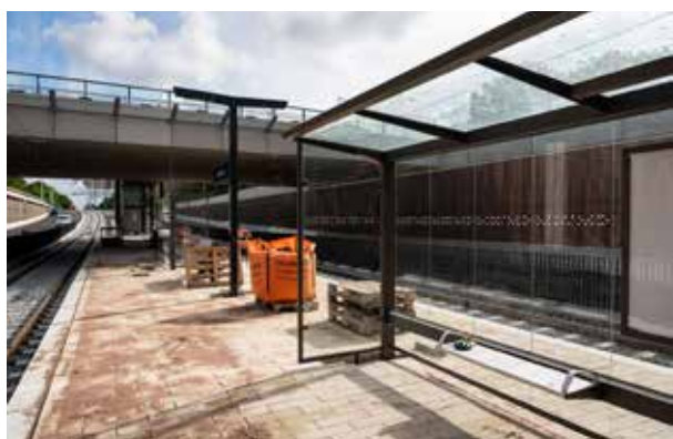
Halte Sportlaan is bijna af.