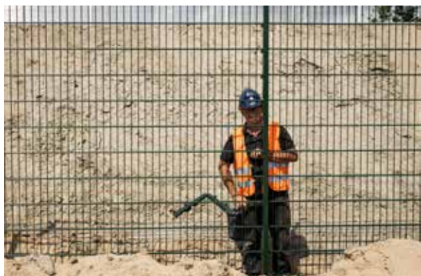
Het hekwerk langs het opstel terrein wordt geplaatst.