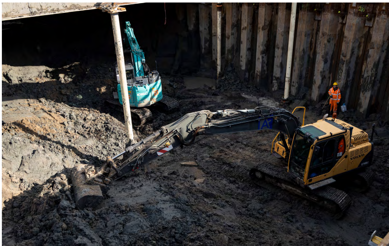
Graafwerkzaamheden bij de Sportlaan