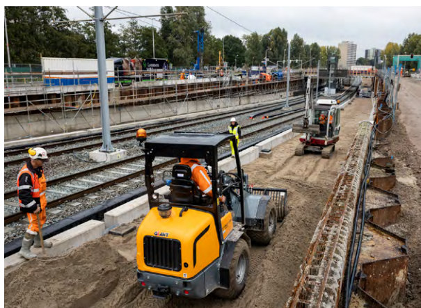
Zand aanbrengen en aftrillen op Kronenburg