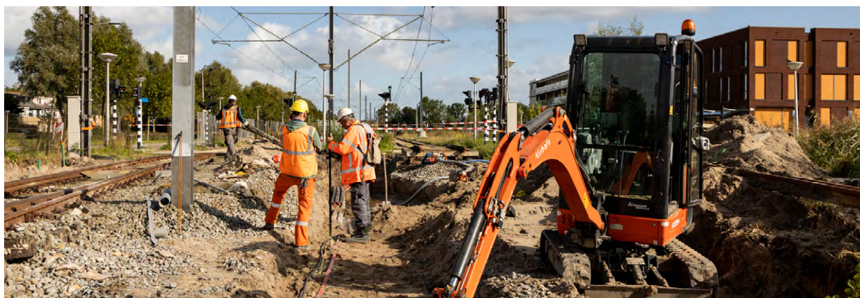
Ondertussen bij Westwijk