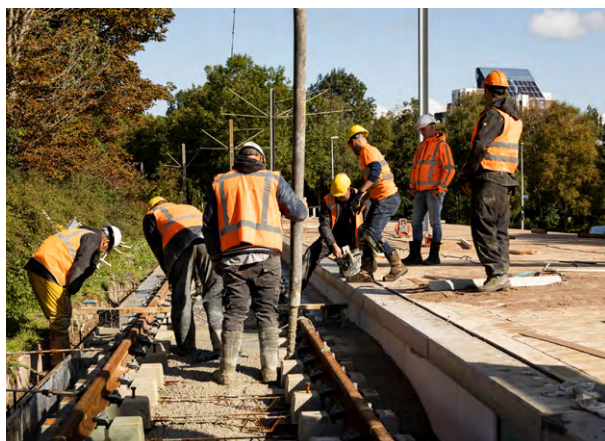
Beton storten op Meent