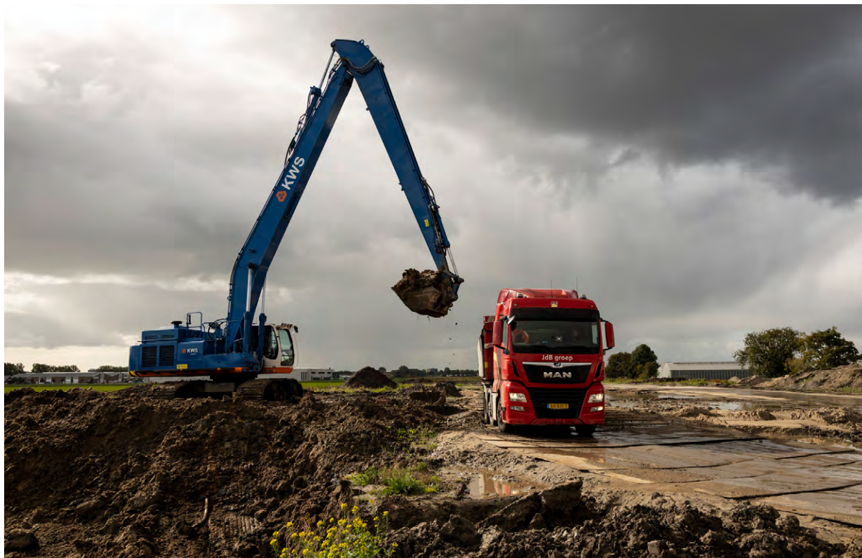
Verwijderen van de voorbelasting op het opstelterrain.

In deze rubriek laten we iedere keer een impressie zien van onze werkzaamheden. Dit keer van de voortgang op het opstelterrain, Sportlaan, Meent, Kronenburg en Westwijk.